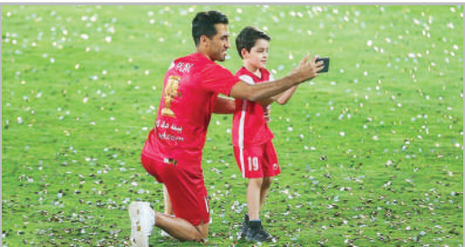
مراسم قهرمانی پرسپولیس در سوپر جام