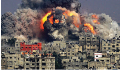
وزیر جنگ رژیم صهیونیستی: دستور محاصره کامل غزه را صادر کردیم

یوآ گالاتنت، وزیر جنگ رژیم صهیونیستی گفت: من دستور محاصره کامل نوار غزه را صادر کرده‌ام. دستور محاصره کامل نوار غزه را صادر کرده‌ام. دستور محاصره کامل نوار غزه را صادر کرده‌ام. دستور محاصره کامل نوار غزه را صادر کرده‌ام.