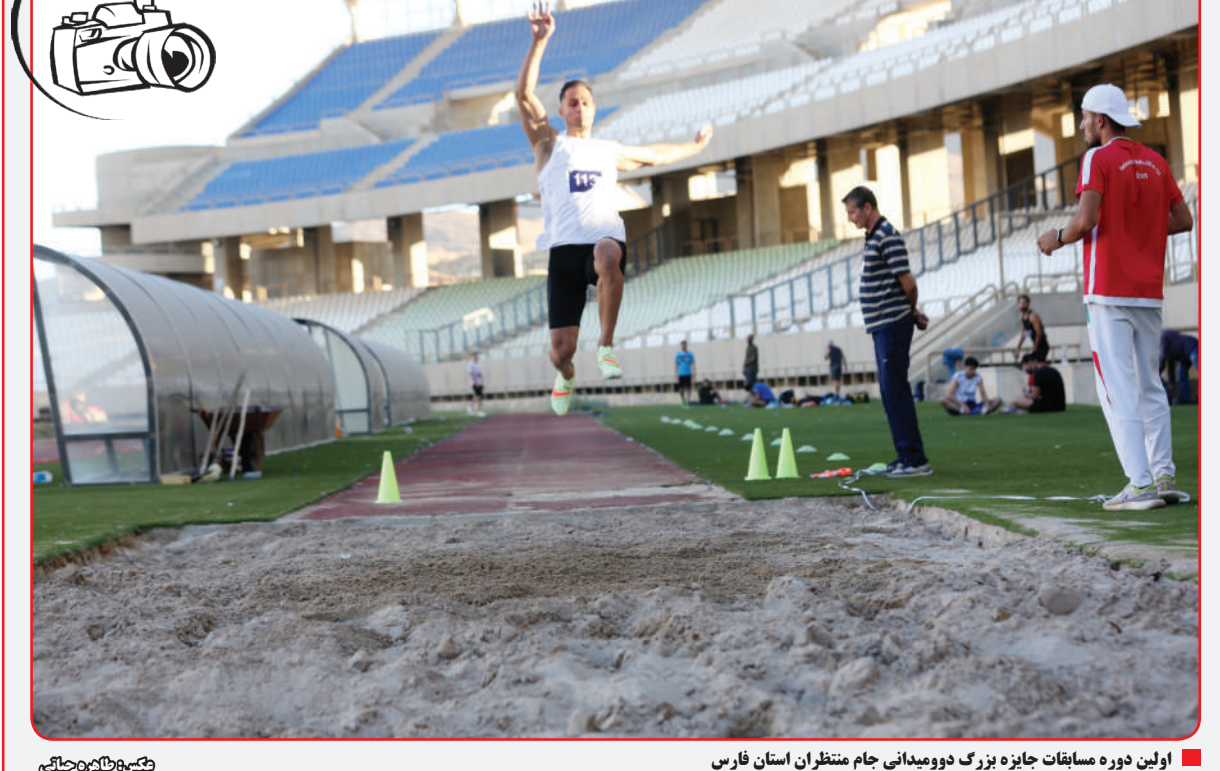
اولین دوره مسابقات جایزه بزرگ دوومیدانی جام منتظران استان فارس