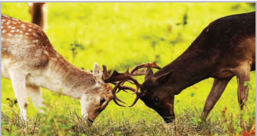
کوزن‌های پارکی در دوبلین - ایرلند