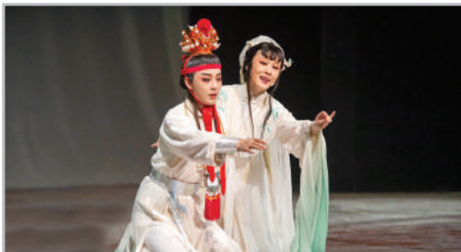
نمایش آیینی چینی‌ها - گلستان