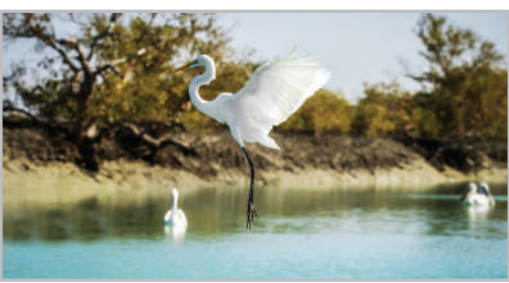
تالاب بین‌المللی آذینی - تنگه هرمز