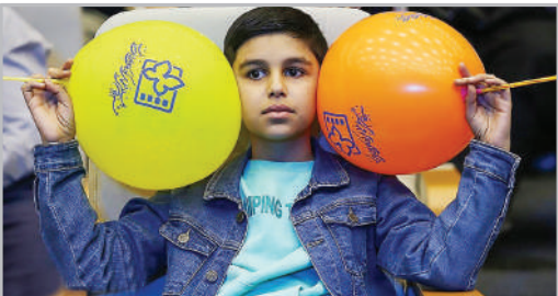
جشنواره بین‌المللی فیلم‌های کودکان و نوجوانان - اصفهان